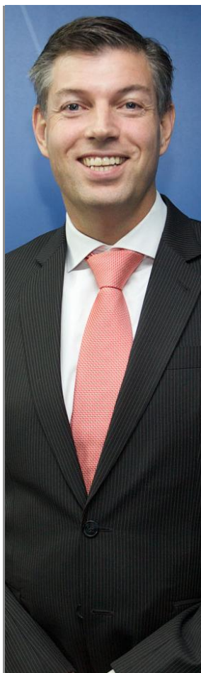
Director general de Novo Nordisk