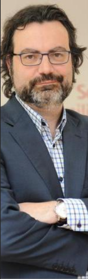
Presidente de Sefac Aragón-Lifara y del Comité Organizador del VII Congreso de Sefac

Pregunta. Haciendo un juego de palabras con el mes en el que celebra, ¿este congreso es para la farmacia comunitaria como 'agua de mayo'?