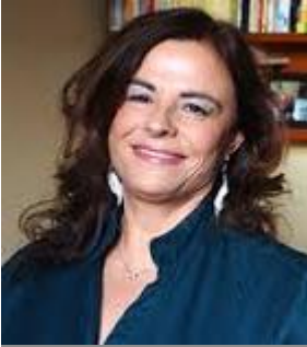
Presidenta de la Fundación Pharmaceutical Care