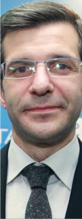
Presidente de la Sociedad Española de Farmacia Hospitalaria (SEFH)

Disculpa este exceso para 'asegurarnos' que llegases a tiempo a la cita. Quizá no era necesario en alguien que presume de estar despierto "antes que Carlos Herrera".