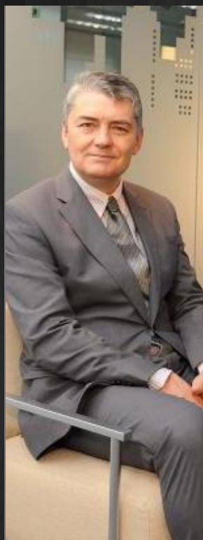
Portavoz de Sanidad por Ciudadanos en la Asamblea de Madrid

Pregunta. ¿Qué balance hace del pleno sobre la Sanidad que tuvo lugar en la Asamblea de Madrid?