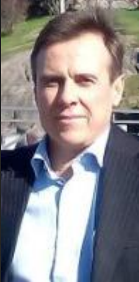
Director General de Kavisha Pharma