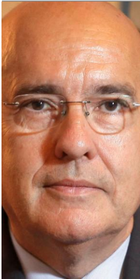
Consejero de Sanidad en funciones de Cataluña

Tras las elecciones, y pendientes de la formación de gobierno, no ha habido presupuestos por lo que se prorrogarán, en principio, los de 2015. Uno de los mayores defectos de los actuales presupuestos se evidencia en el pago a las farmacias. ¿Qué solución tienen para este problema?