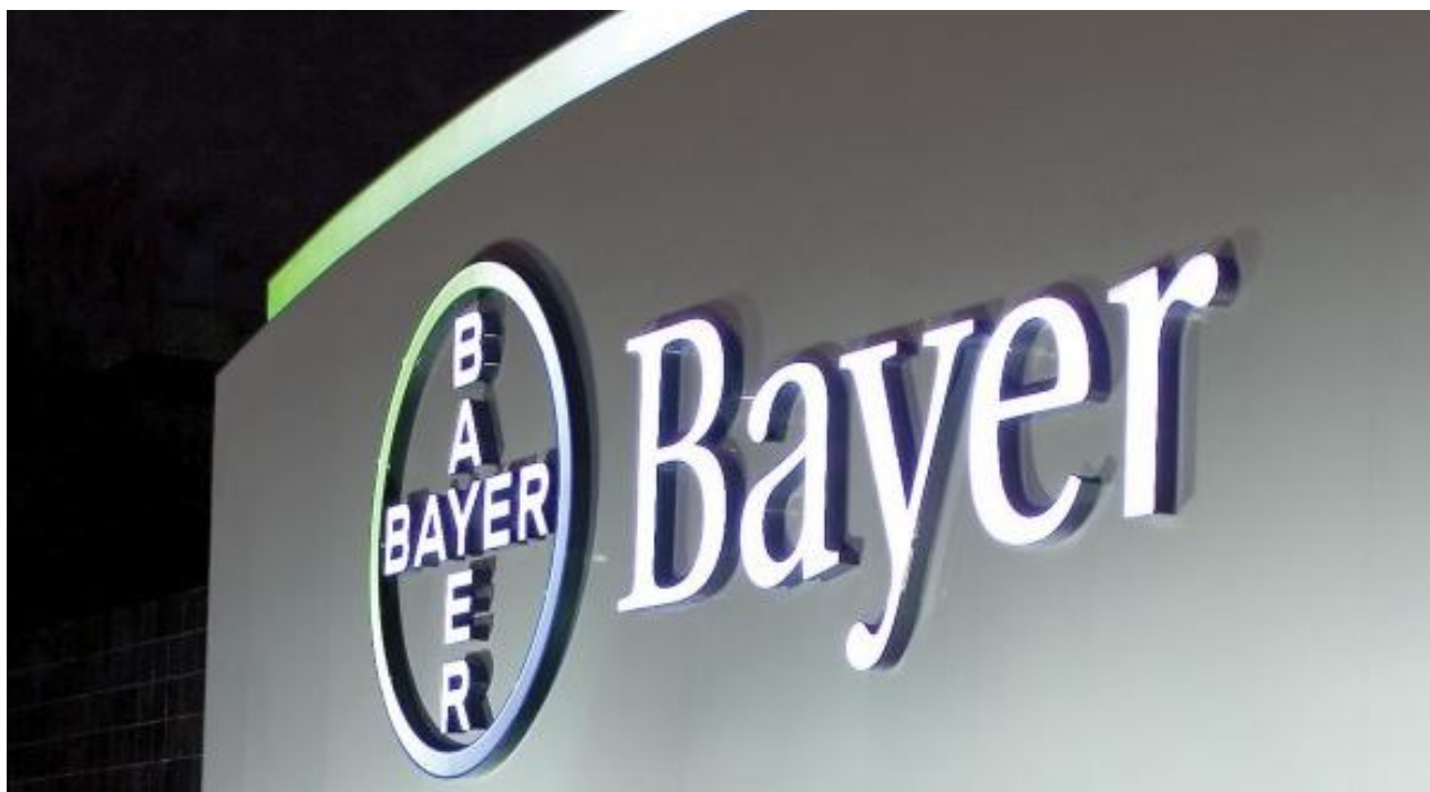
Figura de vuelta para la farmacéutica Bayer

La alemana proponía ayer, con ruptura de resistencias clave, una formación de tipo doble suelo con asa sobre base de canal bajista de corto/medio plazo. Buenos argumentos para intentar plantear un proceso de vuelta en la onda de orden superior.