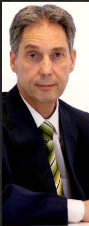
Director general de la sociedad cooperativa Novaltia