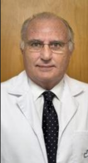
Presidente de honor de la Sociedad Española de Reumatología

¿Cada vez hay más enfermedades reumáticas?