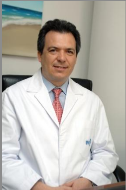
Ginecólogo de la clínica IVI