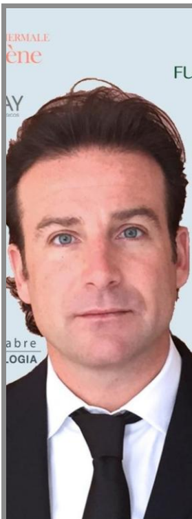
Director general de Pierre Fabre