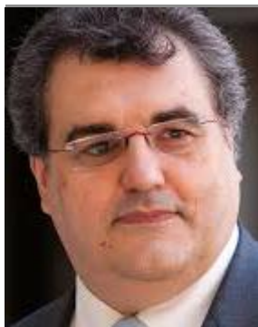
Presidente de la patronal farmacéutica catalana Fefac